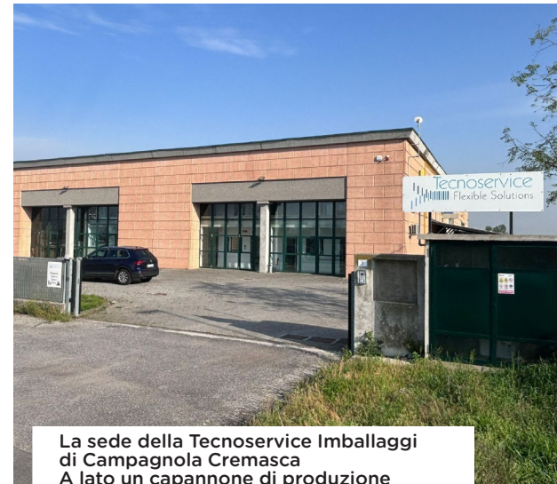
La sede della Tecnoservice Imballaggi di Campagnola Cremasca. A lato un capannone di produzione

Il personale aziendale, a tutti i livelli operativi, segue spe-