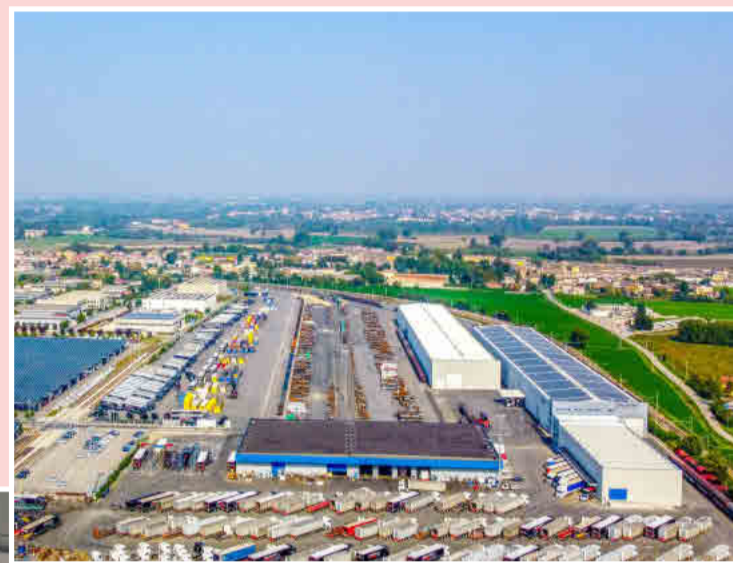
A fianco, un esempio virtuoso di integrazione tra trasporto su gomma e ferroviario da parte di Trasporti Pesanti