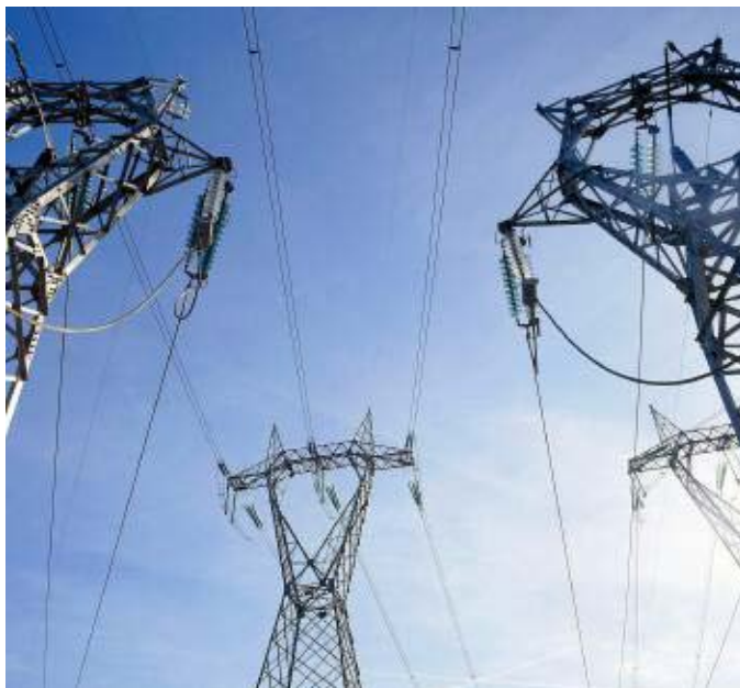
Un viadotto elettrico