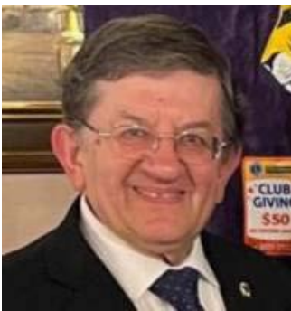
Palmiro Fanti (Fantigrafica)